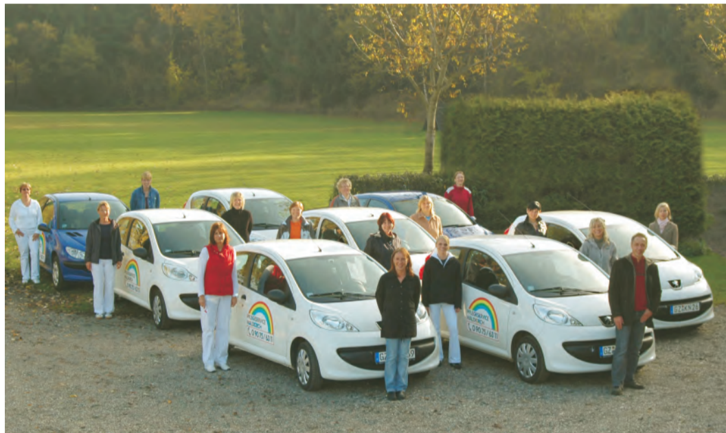
Das Team des Pflegeservice Waldkirch mit dem auf Sparsamkeit und Effizienz ausgerichteten Fuhrpark.

„Wir sind unheimlich stolz auf unsere Mitarbeiterinnen, von denen vielen nun bereits seit über 10 Jahren bei uns tätig sind, sie sind das Herz und die Seele unseres Pflegedienstes“ Derzeit sind es 15 Mitarbeiterinnen, die rund um die Uhr für eine nahezu perfekte Pflege im Einsatz sind. Das Team besteht ausschließlich aus gelernten Pflegefachkräften. Die Mitarbeiter sind in vielen Spezialbereichen der ambulanten Pflege wie z.B. Wundmanagement und Palliativ-